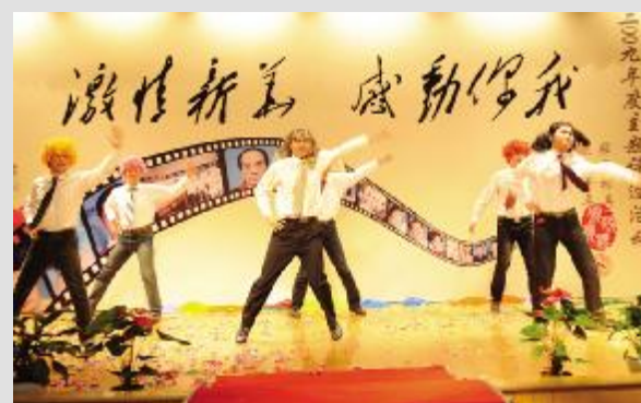
▲倾情演绎自编、自导的精彩节目